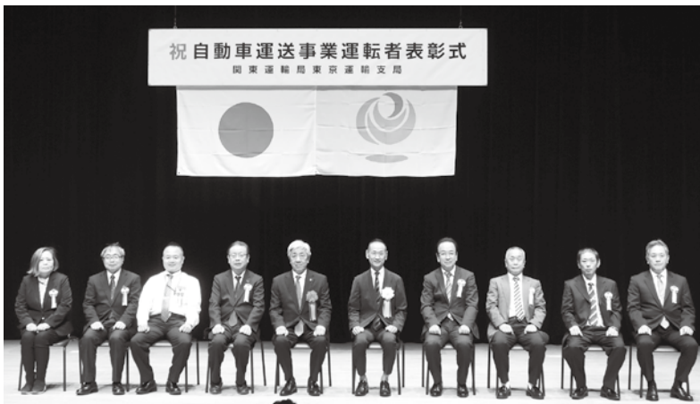
受賞した個人タクシー事業者の皆さん

「自動車運送事業運転者表彰式を挙行し、232名の皆様に表彰しましたことは、私どもの大きな喜びです。本日