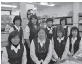
事務員のみなさん