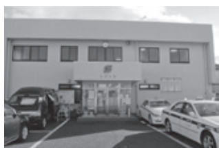
大きな会議室に購買コーナーも完備したビル。