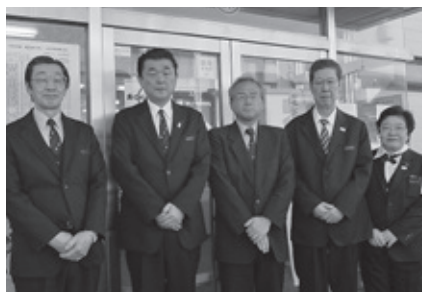
左から松山副支部長、千田支部長、池田副支部長、岸交通共済・無線部長、森総務部長