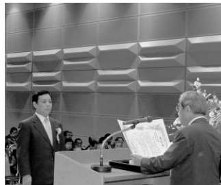
特別優良表彰13年を受賞した野方個人タクシー協同組合

規制緩和により生じた影の部分がクローズアップされ、修正論議が高まってきました。タクシーの質は乗務員・事業者の質。それを維持するには待遇改善を避けて通るわけにはいきません。そのため、私たちは今、運賃改定に向けて申請をしています。認可には、利用者の強いご理解、ご支持が必要です。利用者から求められているのは、タクシーが安全・安心、そして快適な乗り物であること。皆様の日々の仕事ぶりが利用者のご理解とご支持につながります。