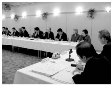
「個人タクシーはPR不足」という意見が目立ちました

使いやすいと思う。また、忘れ物をした場合、法人タクシーは営業所に電話をすればいいが、個人タクシーはどこへ連絡すればいいかわからず不便だと思っていた。そんな誤解が多いと思うので、もっとPRすべきだ。