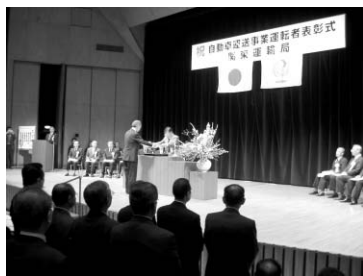
受賞者には良き指導者としての活躍が期待されます

本日の表彰は日々の努力、優れた運転技術、旺盛な責任感の賜物でしょう。ご家族、上司・同僚の理解や支援にも改めて感謝します。